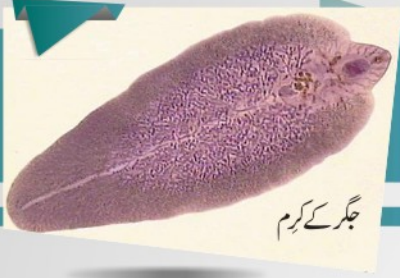
جگر کے کرم