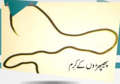
پھیپھڑوں کے کرم