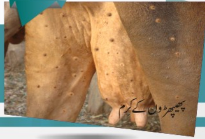
پھیپھڑوں کے کرم

جانور کھانا پینا چھوڑ دیتا ہے، تیز بخار، پانی اور خون کی کمی، رت موتر میں جانور کا پیشاب سرخی مائل ہو جاتا ہے گلیٹیوں میں سوزش ہو جانا گلیٹیوں کے بخار کی ایک نمایاں علامت ہے