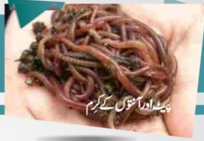
پیٹ اور انتڑوں کے کرم

بے چینی کی کیفیت، خون کی کمی، کمزور اور لاغر، جلد پر سوراخ اور جانوروں کی پیداواری صلاحیت میں کمی اہم علامات ہیں